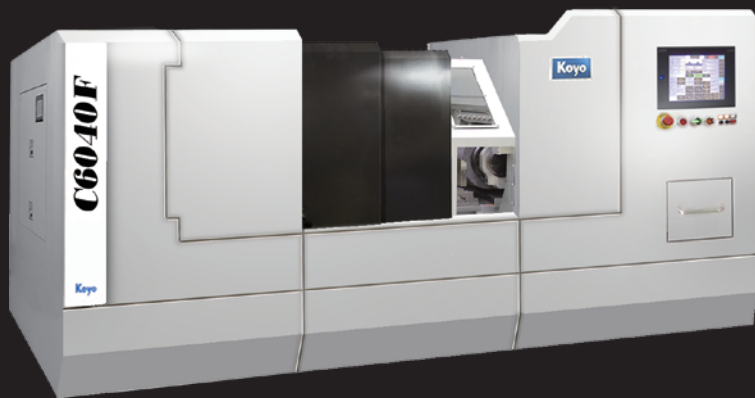
センタレス研削盤 C6040F