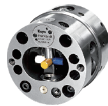
インデックスチャック